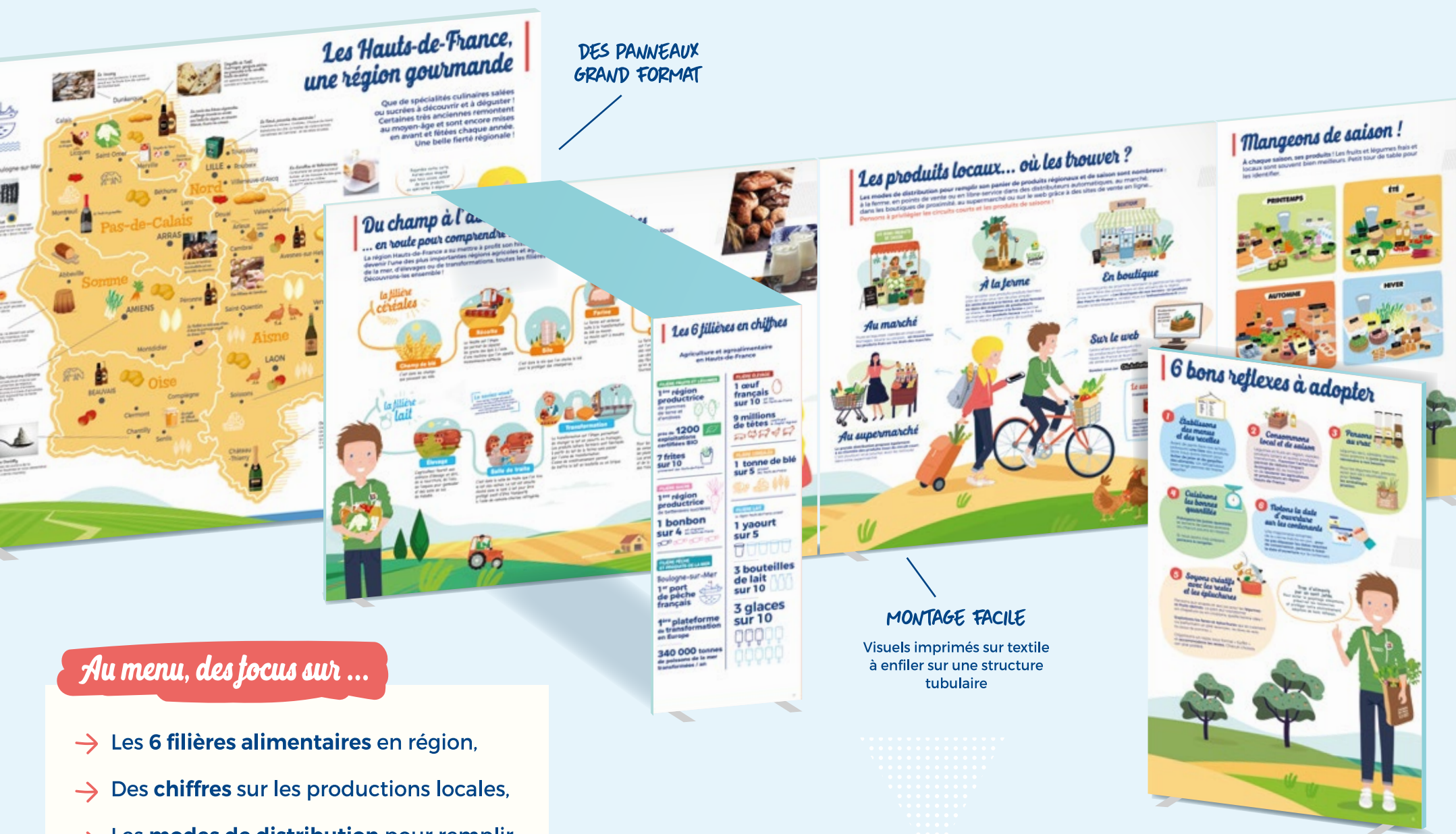
DES PANNEAUX GRAND FORMAT

Alice et Théo invitent adultes et enfants à découvrir les produits et la gastronomie de notre région. Une exposition ludique et pleine de surprises pour rassasier les gourmands et une expérience sensorielle autour des odeurs et textures.